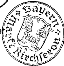
Udo Ockel Erster Bürgermeister